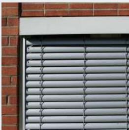
President monterad på utsidan av fönsterkarmen